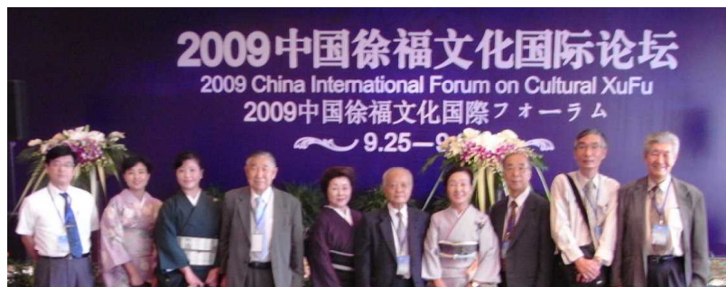
2009年中国浙江省寧波市慈溪市での国際フォーラム

寧波(ニンポー)は、遣唐使の上陸地点であり、また道元が禅を学んだ場所として日本人になじみが深い。その近くの慈溪市に「達蓬山」があり、徐福出港地として多くの伝説が残されている。