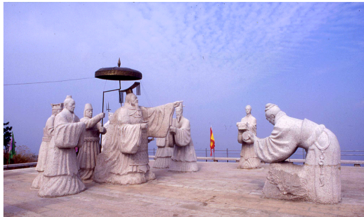
徐福に下命する始皇帝(山東省琅琊台)

中国では、徐福の時代はすでに神話の時代ではなく歴史の時代であり、歴史としての徐福研究も進められている。最近の研究で、徐福の生まれ故郷の地が明らかとなった。一方徐福がどこから出航したかについては、司馬遷の『史記』には記載されていないが、中国の各地に、「徐福の出港地」の伝承が残されている。これらの徐福ゆかりの各地では、徐福像が建立されたり、徐福に関するイベントが開催されたりしている。このうち、慈溪市と連雲港市の様子を紹介する。