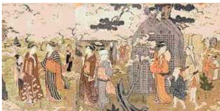
「飛鳥山花見」(1780年代)石碑も描かれている

東京都北区飛鳥山博物館発行の資料によると、飛鳥明神は、和歌山県新宮市の阿須賀明神を分社したものだと言われており、飛鳥山で発掘された仏像も阿須賀明神系のものだった。新宮の「阿須賀明神」は、現在は「阿須賀神社」となったが、今でも境内に徐福を祀る「徐福宮」がある。