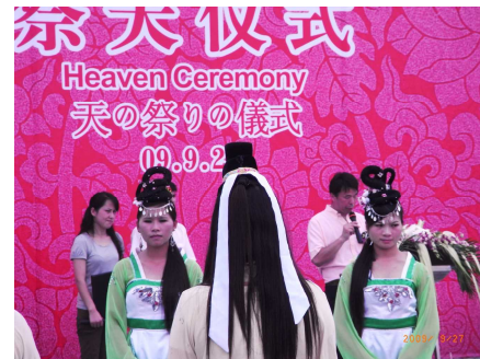
徐福時代の儀式の再現