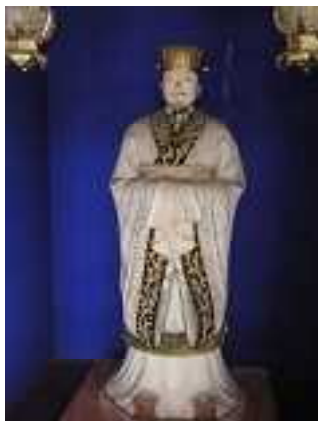
お堂の中の徐福象