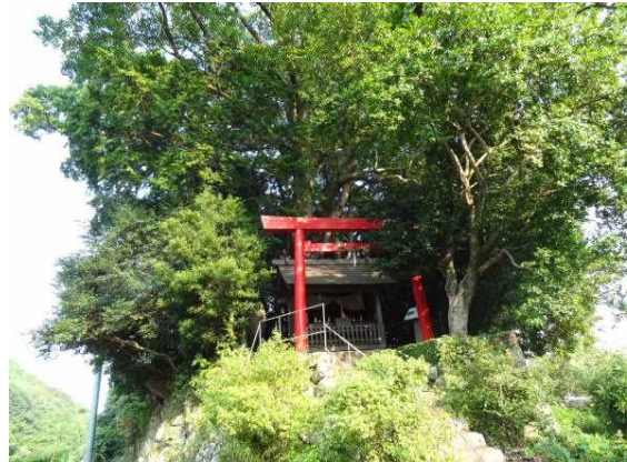
徐福の宮と守り抜いた鎮守の森

となった。しかし氏子たちは明治 40 年、ここに墓を作り、名目上は墓を守るということで密かに徐福の宮を祀りつづけ、戦後に復社を果たしたということだ。明治時代の神社統合により多くの神社が破壊され、鎮守の森が伐採され、徐福の宮の杜も伐採されたそうだが、現在はこんもりとした鎮守の森となっている。