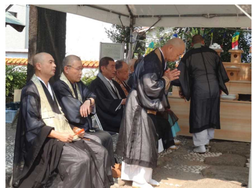
徐福の墓前で僧侶による供養

このほか新宮市内の、蓬莱山南麓の阿須賀神社には徐福を祀った「徐福の宮」、徐福の重臣を祀った「重臣塚」等がある。お盆の夜は徐福の慰霊のための花火