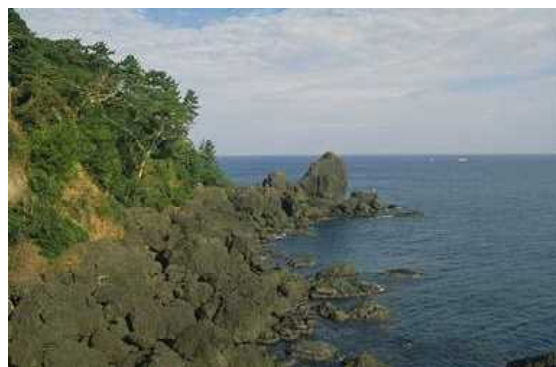
新井岬の先端に新井崎神社がある

伝説では、徐福が伊根町新井に漂着してから、里人をよく導いたので邑長（むらおさ）となり、死後、産土神（うぶすながみ＝生まれた土地の守護神）となり、現在も新井崎（にいざき）神社に祀られている。伝説の内容は江戸時代安政年間の記録にあり、最近それを石碑にして建立した。なお、この地区の地形は海岸段丘が発達し、独特の景観を呈しており、また近くには浦島太郎伝説地もあり、仙人が住む神仙思想にふさわしい地形となっている。