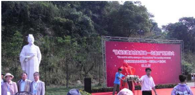
徐福公園の徐福像除幕式

「達蓬山」とは、「海の彼方の仙人の地である蓬莱に達する山」の意味だ。最近達蓬山を公園として整備し、ここで 2009 年に国際徐福フォーラムが開催された。日本、韓国を含む研究者が発表を行い、また新たに作った徐福像の除幕式、徐福時代の儀式の再現劇が行われた。