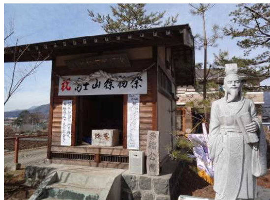
徐福公園(2013年2月、徐福祭開催)

富士吉田には、徐福雨乞い地蔵があり、平成11年に徐福祠と徐福像が建てられた。また、市内の福源寺には、「鶴塚」と呼ばれる石碑が残されているが、そこに書かれているのは、徐福が死んで3羽の鶴に化身し、空に舞い上がり、その鶴が千何百年か経ったころ1羽が死んで福源寺に落ち、それを葬ったのが鶴塚だと言う。このほか、徐福の祠、徐福の墓などがあり、さらには徐福が書いたと記されている『富士古文献』まであるが、これは近年に書かれた偽書とされている。