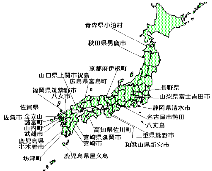
徐福渡来伝承地